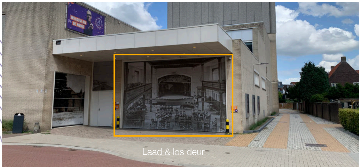
Laad & los deur

Heb je een decor stuk bij welke uit een bakwagen of vrachtwagen moet komen deze staat aan onze in hoogte verstelbare dock